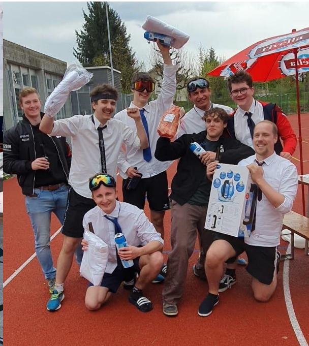
ESV Active 2