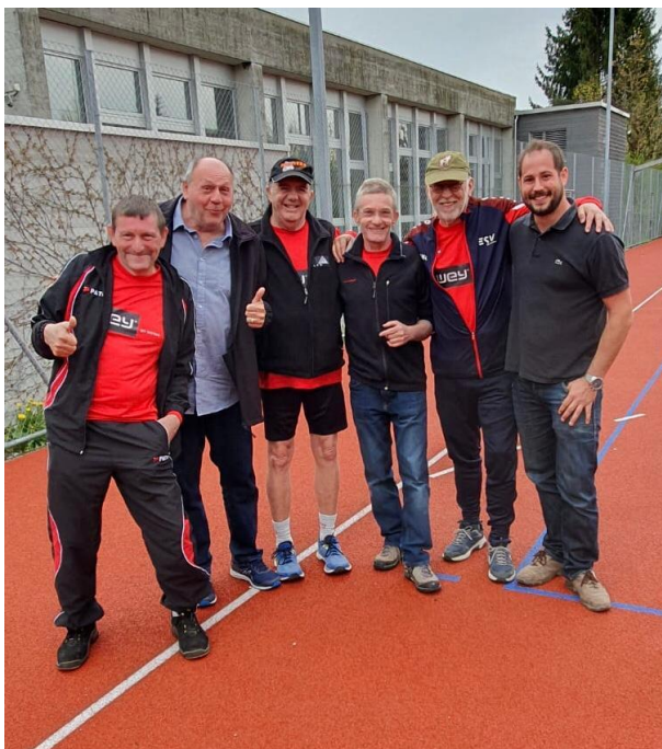
ESV MR Faustball